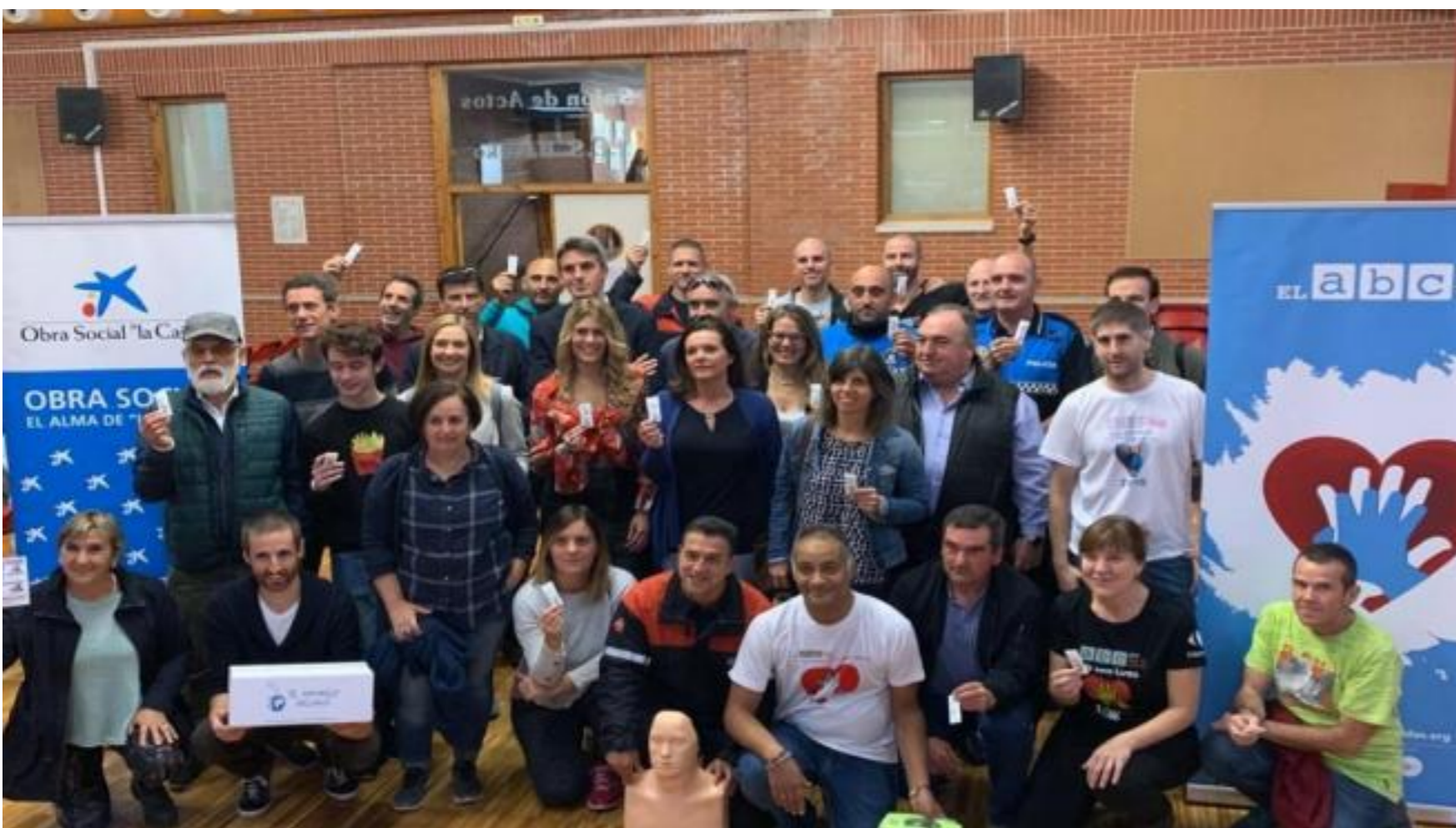
Presentación del nuevo proyecto. CAIXABANK

CaixaBank, a través de la Obra Social de La Caixa, y la asociación 'El ABC que salva vidas' han presentado este miércoles las novedades del nuevo proyecto para mejorar las tasas de supervivencia de la muerte súbita junto a la fundación 'El Azucarillo Solidario'.