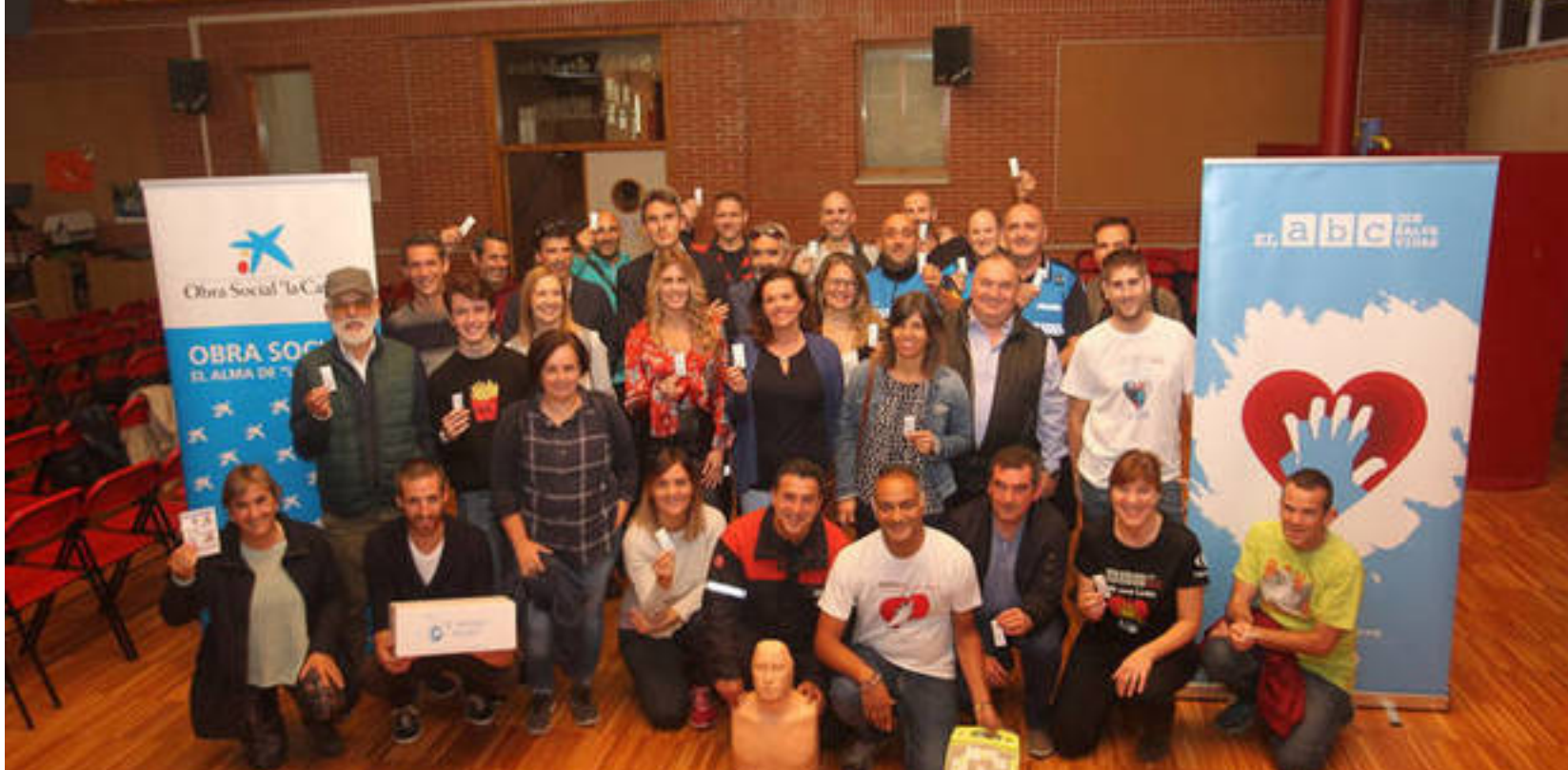
Personas de El ABC que Salva Vidas, de la Caixa, de El Azucarillo Solidario, de Cafenasa, de policías locales, de bomberos, del Servicio Navarro de Salud-Osasunbidea, de SOS Navarra, de la Escuela de Música de Egiús, de IDM, supervivientes, profesores y colaboradores, ayer en la presentación.